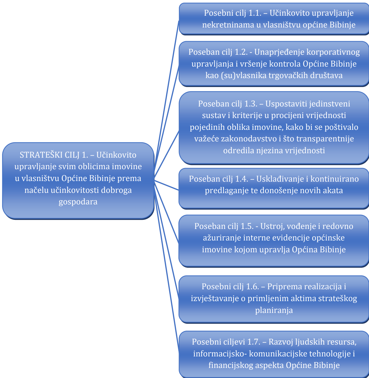
Slika 2. Kaskadiranje strateškog cilja upravljanja općinskom imovinom